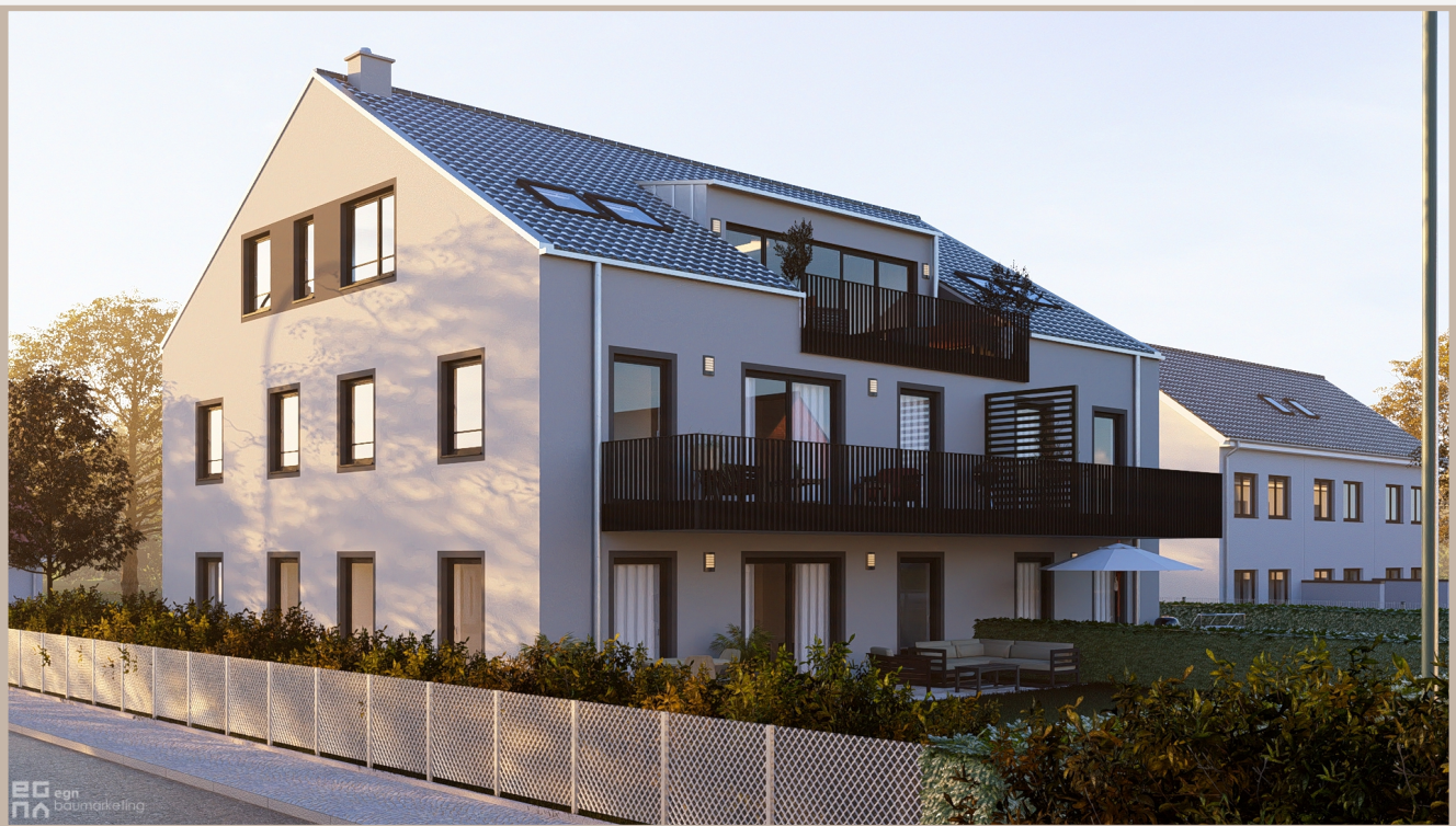
aus der Sicht des Illustrators

Helles und Offenes MFH mit 5 Wohneinheiten. Luxuriöses Penthouse, 2 Erdgeschoßwohnungen mit großen Privatgärten und 2 Obergeschoßwohnungen mit Südbalkonen